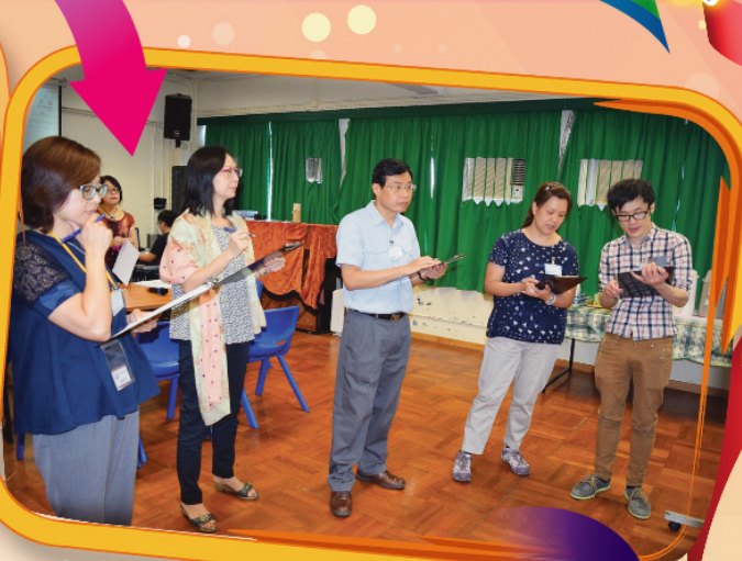
評審委員仔細評審作品