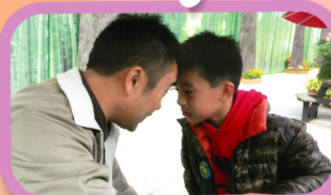
主題：頭頭碰 獎項：公開組冠軍