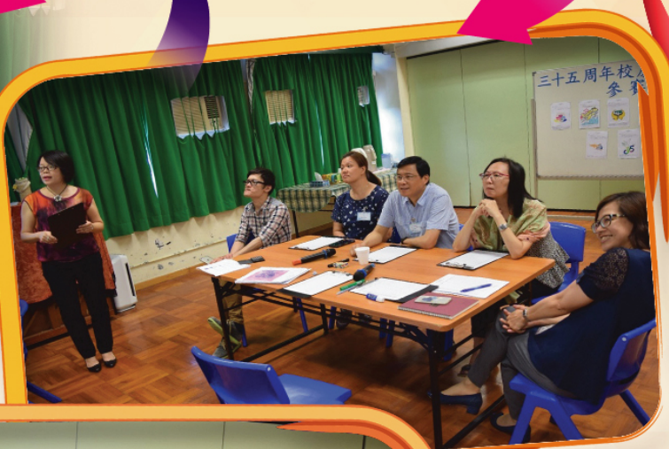
評審委員 專心聆聽 比賽得獎 結果