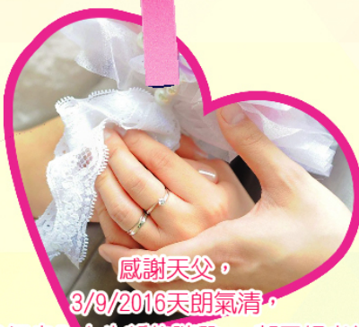
感謝天父， 3/9/2016天朗氣清， 我倆步入人生新的階段 - 郭雪娟老師