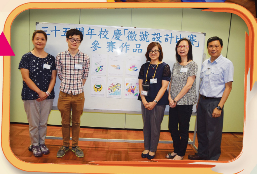
評審委員於得獎作品前合照