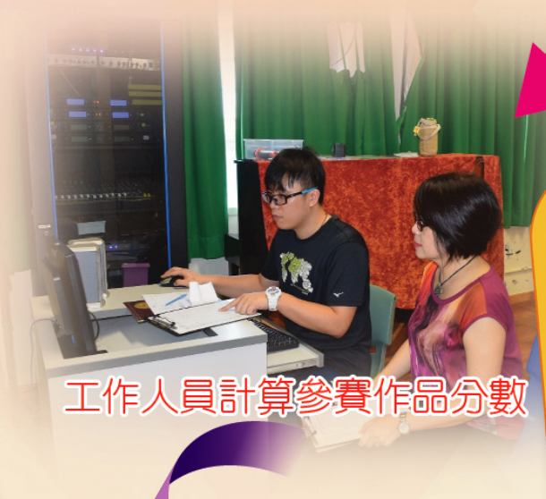
工作人員計算參賽作品分數