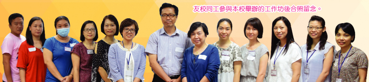
友校同工參與本校舉辦的工作坊後合照留念。

本校於2015-2017年度獲教育局專業支援組的邀請成為專業發展學校，參與為期兩年的專業發展學校計劃。我校以「學習進程架構」的校本實踐為主題，每年支援三所友校的教師在校本評核機制及學習記錄中運用學習進程架構的發展。透過分享會、工作坊、工作會議、聯校觀摩會議及聯校網絡交流等活動，加強教師對「學習進程架構」理念與應用的認識，從而推動各友校於校內發展一套符合校情的「學習進程架構」系統。