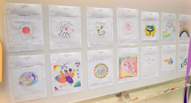
展示 - 參賽作品