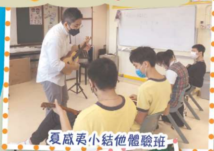
夏威夷小結他體驗班