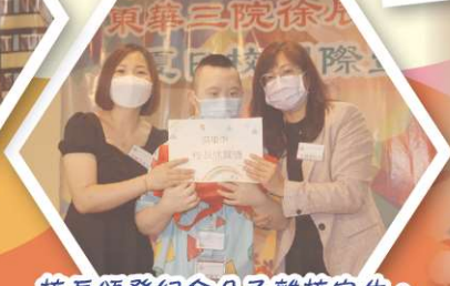
校長頒發紀念品予離校宿生。