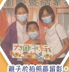
親子於拍照區留影。