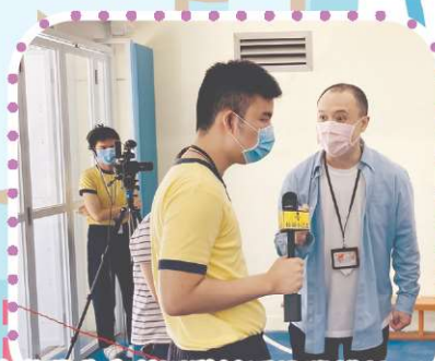
有些學生會於活動前向同學講解玩法、亦有些學生於活動後採訪同學活動後感。