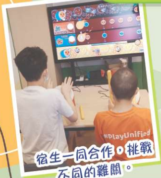
宿生一同合作，挑戰不同的難關。