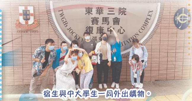
宿生與中大學生一同外出購物。