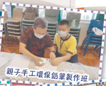
親子手工環保鉛筆製作班