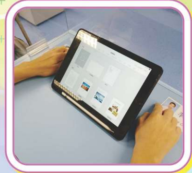
使用Pages能自己選最合適的模式，做到自主學習的目標。