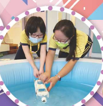
活動中都有涉及體驗科學的元素，令活動更有趣味性。活動中，我們會協助同學參與活動。圖中是動力船，只要調教好螺旋槳，放在水面後，船會自動向前進啦。