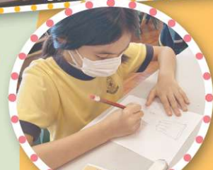
水洗牛皮紙皮具設計班

新型冠狀病毒病疫情侵襲，卻未阻老師及學生參與活動的熱情！學校於暑假期間舉辦了11個不同類型的暑期活動，包括藝術、音樂及體育活動，另外更有電影欣賞活動，豐富多彩的活動讓學生充分享受其中，渡過一個難忘的暑假。