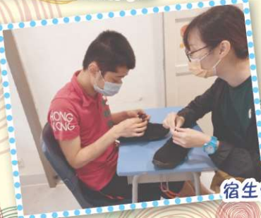
宿生們一同學習實用的自理訓練。