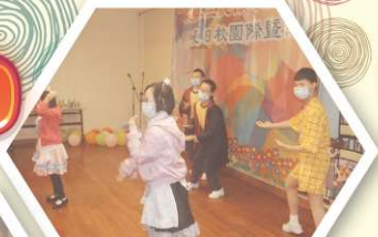
宿生落力表演，帶動全場觀眾一起跳「蟹舞」。