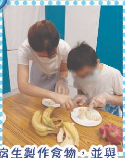
宿生製作食物，並與宿舍職員分享。