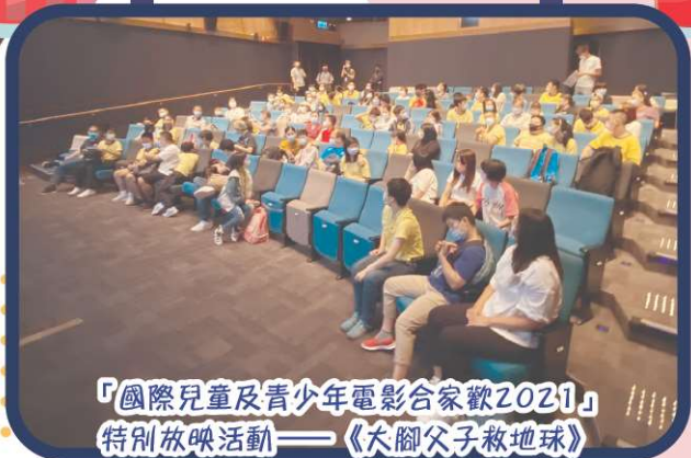
「國際兒童及青少年電影合家歡2021」特別放映活動——《大腳父子救地球》

在二零二一年八月一日至八月三十一日的期間，本校在黃竹坑港鐵站近B出口港鐵社區畫廊有公開展覽，以「我眼中的你、我、他」為主題。透過展覽活動推動本校學生的視藝科作品及讓更多人士認識本校學生的才能。