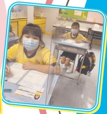
B組學生正在專心地「寫手冊」。