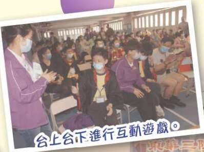
合上合下進行互動遊戲。