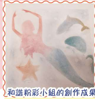
和諧粉彩小組的創作成果。