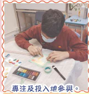
專注及投入地參與。