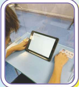
按自己的學習進度及需要，進行個別輸入的模式。