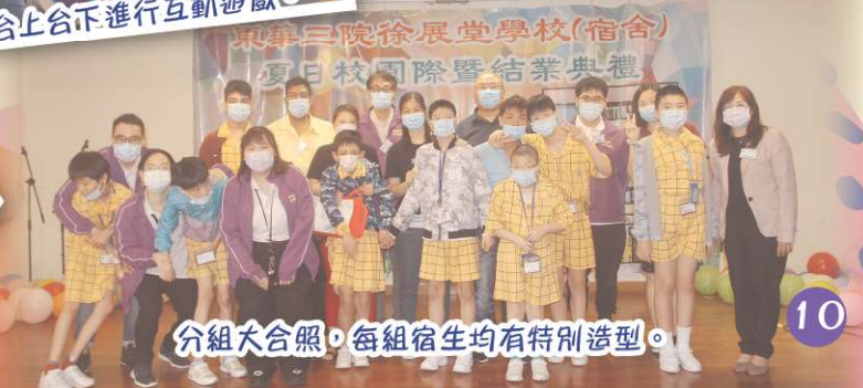
分組大合照，每組宿生均有特別造型。