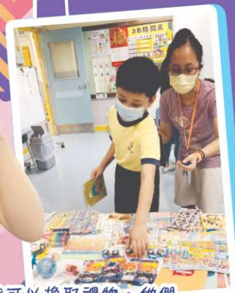
完成一定的遊戲可以換取禮物。他們不僅在參與活動有獎，帶領時表現出色亦有禮物作鼓勵。