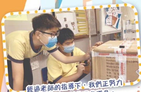
經過老師的指導下，我們正努力設計攤位，製作遊戲道具。