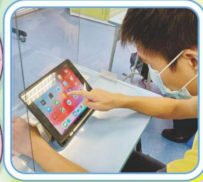
課堂開始時，學生主動使用Pages做自己的筆記。

此程式不但代替紙筆記錄，更可以加插影片、音訊、圖片到筆記，讓學生能加以打好課本知識，亦可提升學生運用不同的資訊科技。