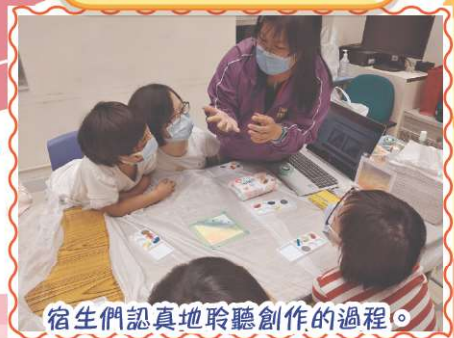
宿生們認真地聆聽創作的過程。