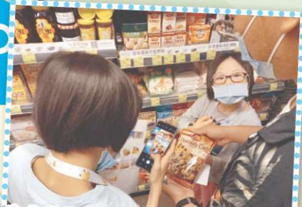
宿生運用手機，檢查外出購物清單。