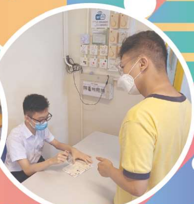
我們都有不同的任務，協助攤位順利進行。