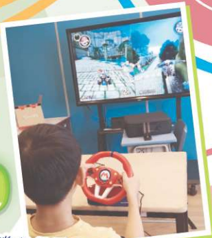
賽車遊戲很受宿生歡迎。